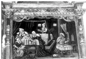
RETABLO MAYOR Natividad de la Virgen en el tercer cuerpo del retablo.

Texto y fotos F.J. Ignacio López de Silanes Valgañón