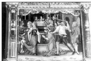
RETABLO MAYOR Degollación del Bautista en el segundo cuerpo del retablo.