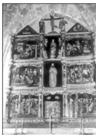
RETABLO MAYOR SIGLO XVI formado por zócalo, tres cuerpos y ático divididos en tres calles.