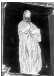
RETABLO MAYOR Imagen hispanoflamenca de San Juan Bautista, siglo XVI.

La iglesia, donde se agrupan la nave principal, la nave de la epístola, la casa parroquial, la sacristía, y el remate de la torre. El alero de la nave principal se apoya en canchillos del siglo XIV. Sobre el muro sur de la nave principal el escudo de los Zúñiga.