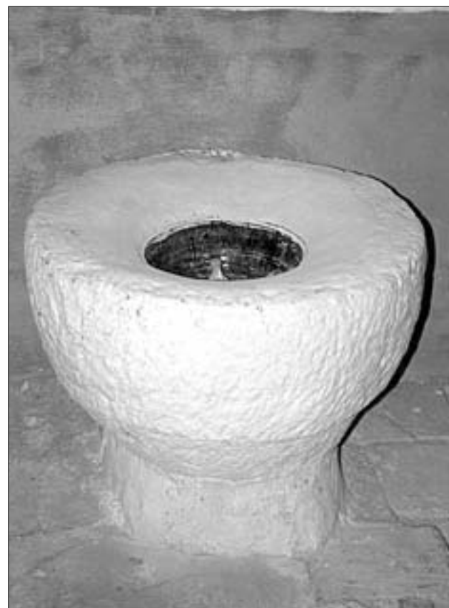
F.J.I. LÓPEZ DE SILANES

En Herce, Santa Eulalia, Arnedo y en las Bergasillas se desarrolló el eremitismo en la alta edad media, produciendo posteriormente diversos monasterios. Es posible que el origen de la iglesia románica sea eremítico pudiendo desarrollarse como un núcleo protomonástico, lo que en cierta forma explicaría su ubicación fuera de la población, que también enlaza con el uso de técnicas de construcción de tradición prerrománica en esta iglesia. Sea como fuere, esta iglesia podría datar de la época de repoblación, no olvidemos que Calahorra