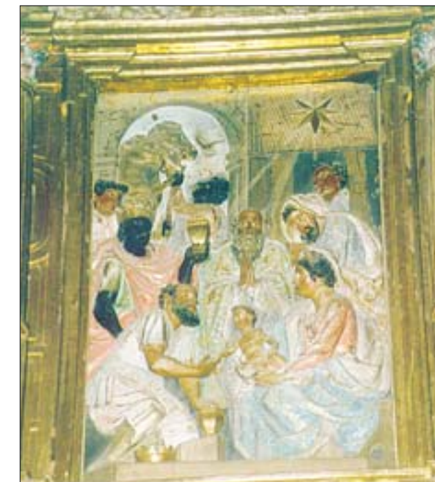
A la izquierda, Epifanía en el retablo mayor. A la derecha, imagen de San Roque, de fines del XVI