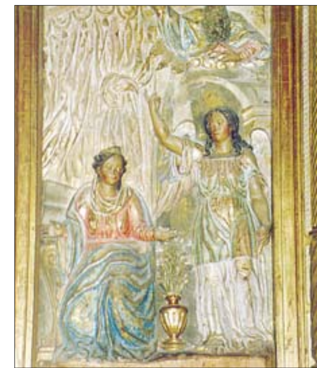
Retablo mayor: Anunciación y Natividad