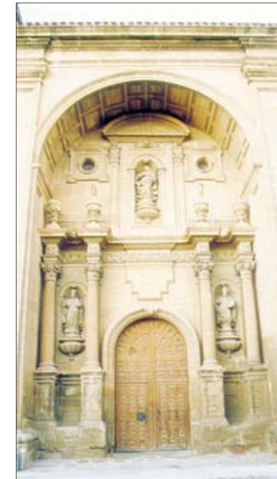
A la izquierda, gran portada barroca tipo retablo, bajo un arco triunfal, en el muro sur. A la derecha, vista del retablo mayor