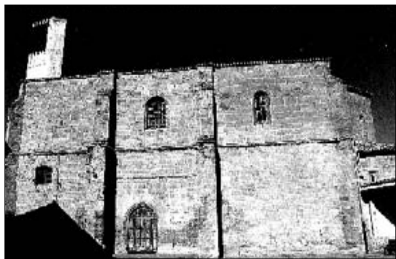
Texto y fotos F.J. Ignacio López de Silanes Valgañón

fondo una pintura de la Jerusalén Celeste, bajo un frontón curvo relleno con el Padre Eterno. Las alas laterales se adaptan a los ochavos del presbiterio, mostrando esculturas en relieve sobre tabla: la Natividad y la Epifanía en el primer cuerpo, y en el segundo, las escenas ecuestres de San Martín con el mendigo y de San Millán Matamoros.