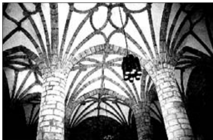
Nervios de las bóvedas góticas sobre fondo blanco que apoyan en cuatro columnas cilíndricas.

La de Camprovín está formada por tres naves de igual altura distribuidas en tres tramos, que se remata en una cabecera ochavada de cinco paños, siendo, como en Anguiano, el primer tramo el más largo, decreciendo la longitud del tramo a medida que se aleja del presbiterio. Presenta contrafuertes en las esquinas, en los entretramos y en las entrenaves, que contrarrestan los esfuerzos laterales de las altas bóvedas góticas, que descansan en cuatro pilares cilíndricos, desde donde se despliegan los nervios como las ramas de la palmera.