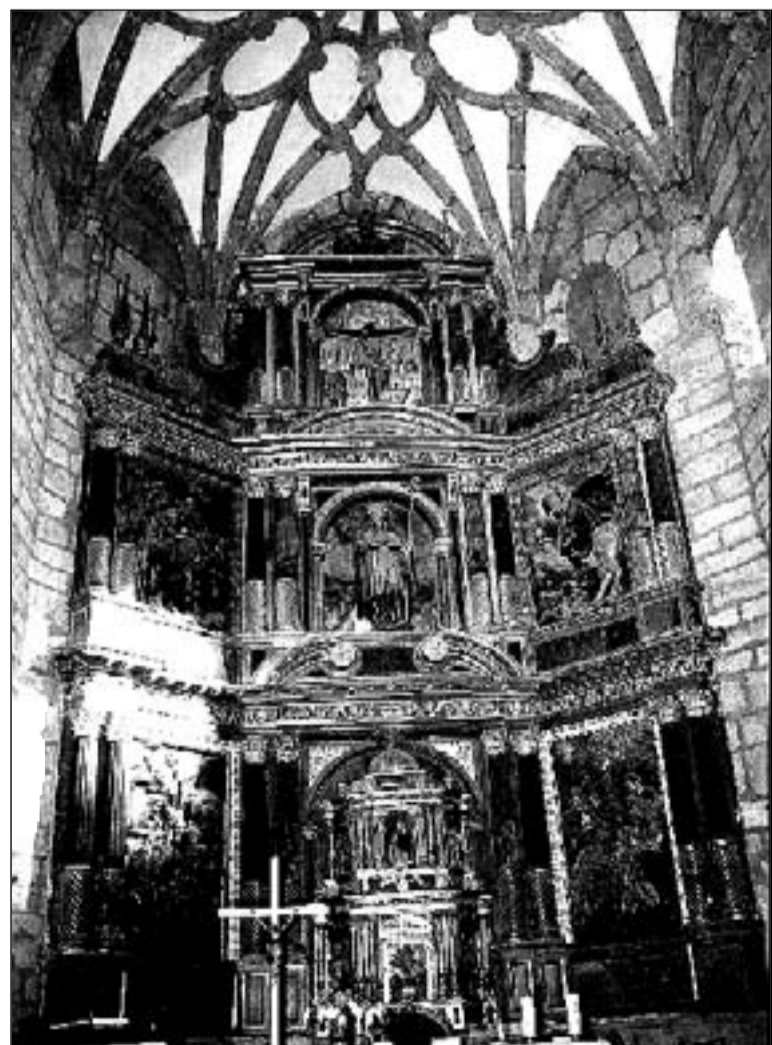
A la izquierda, templete del XVII. Sobre estas líneas y de arriba a abajo, fachada meridional con el campanario de Gerardo Cuadra, San Roque peregrino del XVIII y el retablo mayor.

Bibliografía: M. Valgañón, J.G. Inventario artístico de Logroño y su provincia. Madrid 1975.