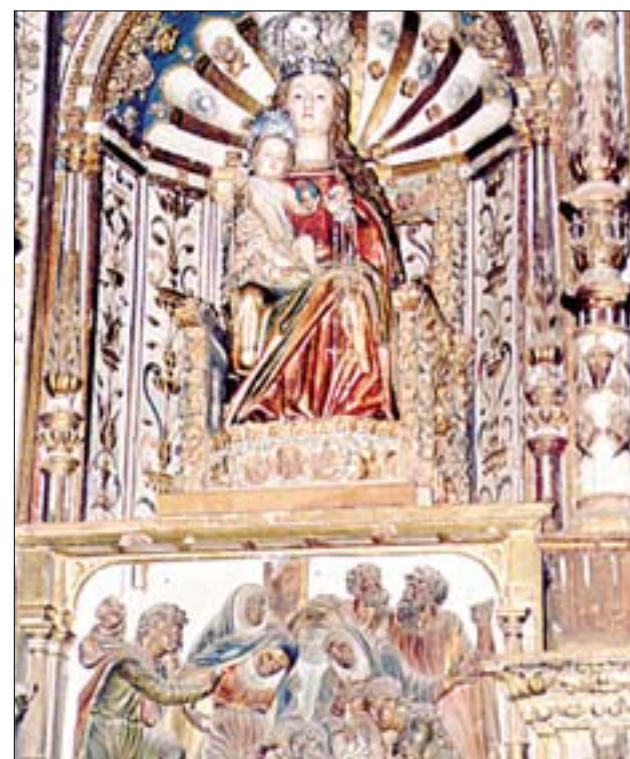
Virgen de la Silla e imagen de San Miguel