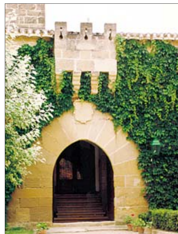
Puerta en la muralla norte, bajo matacanes con el escudo de los Velasco y Osorio. Esquinazo cuadrado y detalle del escudo

El castillo debió tener también un foso, alimentado por un canal desde el río, del que queda el canal que discurre junto