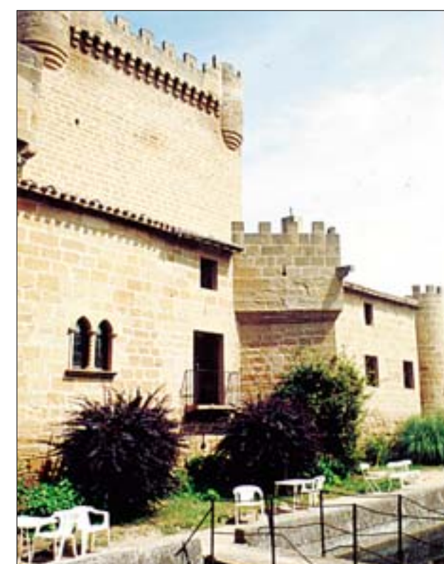
Fachada sur sobre el antiguo foso. Vista del castillo y del molino desde el puente