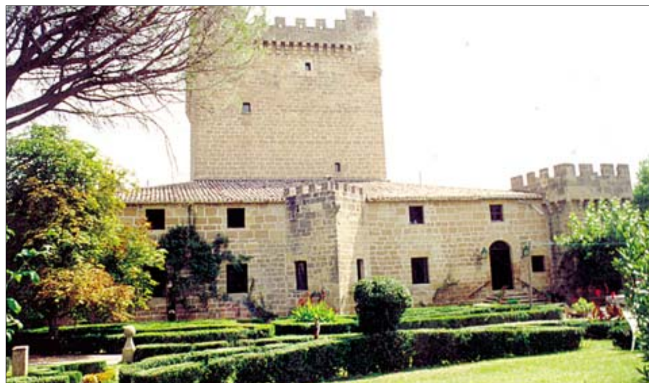
Fachada este, con cubo redondo oculto por los árboles, espolón central, cubo cuadrado a la derecha y la torre homenaje. Vista sureste, con el esquinazo cuadrado