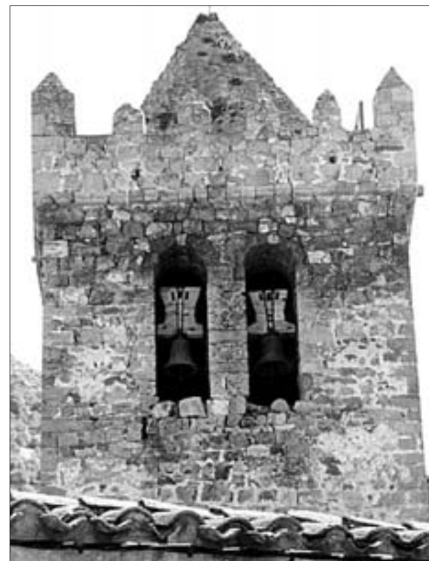
Torreón del XII, transformado en campanario

Lo más emblemático de la iglesia de San Pedro es su torre-campanario, de estilo románico, posiblemente de finales del siglo XII, que se levanta al norte de la iglesia, incorporándose a ella como capilla a modo de brazo de crucero. Es de planta cuadrada con dos cuerpos, estando el superior almenado, recuerdo de su primitiva función como atalaya. En la fachada sur se conservan dos canecillos protogóticos del siglo XIII, lo que podría ser un indicio de que el templo que precedió