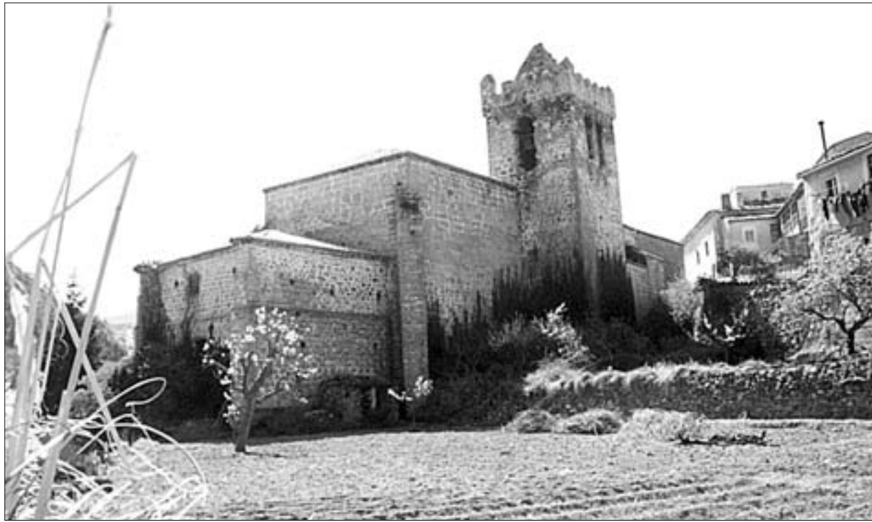
Fachada norte, torre románica almenada y sacristía nueva, entre las huertas del río Cidacos