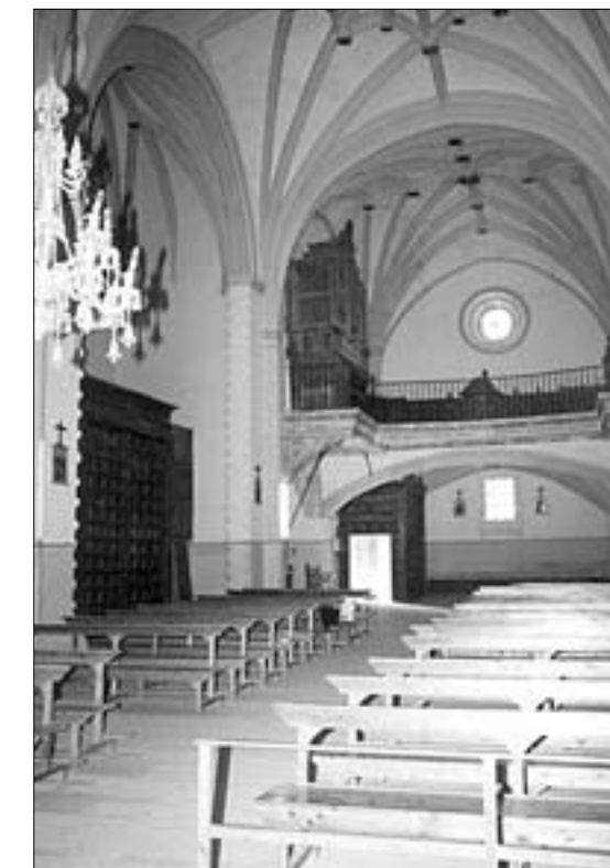
A la izquierda, la nave y el coro. A la derecha, el retablo mayor