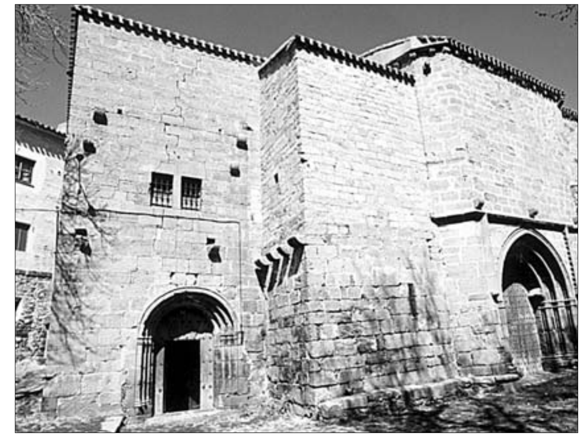
Fachada sur. Sobre la puerta de la izquierda existen mensulones que soportaron un cadalso