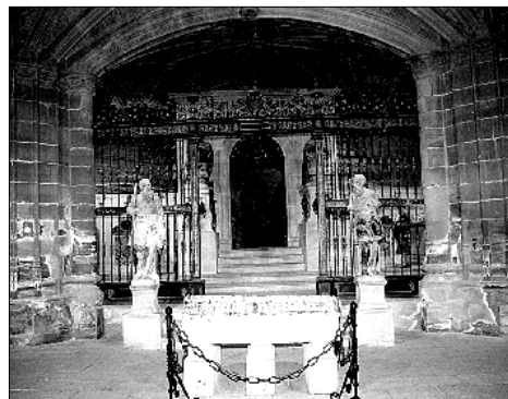
En la imagen superior, detalle del Pantocrator. Sobre estas líneas, a la izquierda, el sarcófago de la Reina de Castilla conocida como Blanca de Navarra, en la entrada al Panteón Real. A la derecha, vista de la cara posterior de la tapa del sarcófago

Por su parte, Ramiro II buscó otras alianzas, prometiendo a su hija Petronilla al conde barcelonés Ramón Berenguer IV en 1137, y poniendo así las bases de la Corona de Aragón, ensamblando el Valle del Ebro con la costa catalana. En 1149 los reyes García Ramírez de Navarra y Ramón Berenguer IV de Aragón firmaron un tratado, en el que concertaron