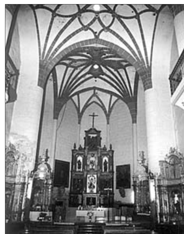
Nave, presbiterio, retablo mayor, bóvedas, y capillas de la iglesia de la Asunción; Virgen del Villar (finales del XIII); y Cristo gótico del siglo XIV sobre cruz nudosa