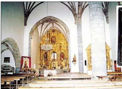
Vista interior de las dos naves, la capilla del Cristo, y el presbiterio. A la derecha, relieve de la Piedad del siglo XVI

Quizás para romper esto, se añadió a la nave del evangelio una cabecera de planta cuadrada, más estrecha y