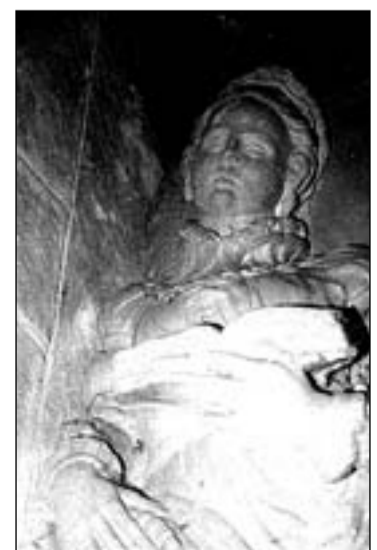
Estatua yacente de la otra dama de la capilla de los Ramírez.