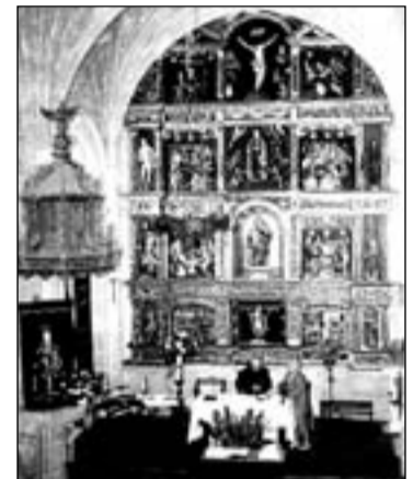
Vista de la nave hacia el frente, el retablo procedente de Negueruela cubre totalmente el presbiterio ochavado.