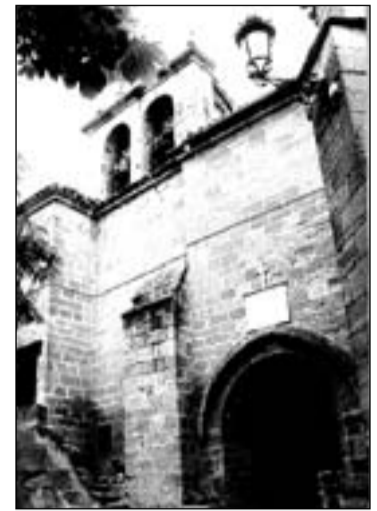
Fachada sur, portada, espadaña y cubo de escalera.