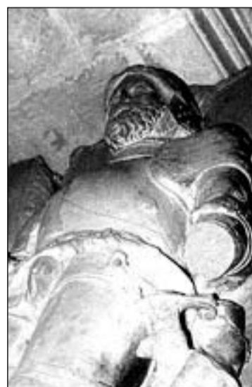
Estatua yacente de Francisco Ramírez.

con la mano izquierda. Sin embargo, las tallas de Catalina Molina y Frías de Salazar y de la otra mujer situada en el altar de la Virgen del Rosario, se muestran más impregnadas del espíritu renacentista, por el tratamiento del peinado y de los pliegues de la túnica, por el libro abierto en una mano y el rosario en la otra. La gracia de las facciones y el naturalismo de las figuras de estas mujeres nos introduce en la escultura renacentista española.