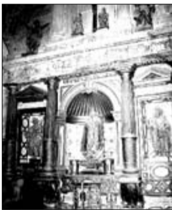
Retablo de la capilla de los Ruiz del Castillo.

De planta cuadrada cubierto con cúpula sobre pechinas rematada en linterna. Se abre a la nave mediante un arco cubierto con una reja de la época. El muro oriental está ocupado por el retablo con arquitectura labrada en piedra. En la pared norte se encuentra la tumba de los fundadores, centrada en sus estatuas orantes dentro de una arquitectura monumental esculpida en la propia pared. La sacristía se localiza al este del panteón, estando cubierta mediante una bóveda de terceletes y combados, con los símbolos del escudo en las claves. Al oeste está la escalera de la balconada que utilizó la familia para seguir los oficios religiosos, de la que todavía puede verse los mensulones en que apoyaba; todo con reminiscencias escorialenses. El sepulcro de Pedro Ruiz del Castillo y Juana de Encío fue construido bajo un frontón curvo, roto por el monumental escudo, todo soportado por dos pares de columnas estriadas, que inscriben el arco